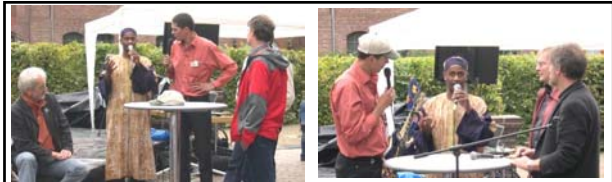
Beteiligung und Qualität der Gesprächsrunde (ca. 2.500 Besucher)