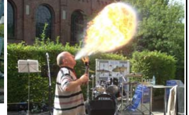
Aktionen für Kinder zum Thema Wasser und Feuer