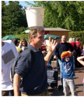
Weltkindertag im Maximilianpark und Eine-Welt- und Umwelttag 2005