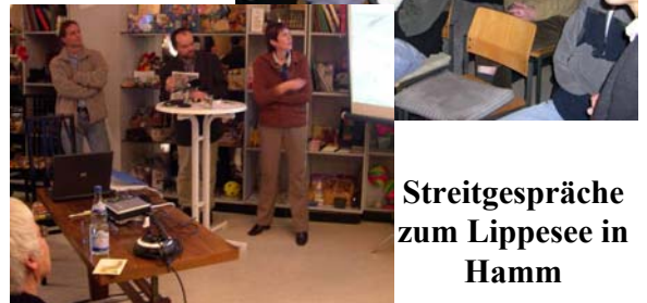
Streitgespräche zum Lippesee in Hamm