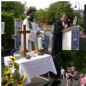
Eine-Welt- und Umwelttag 2006 in Hamm