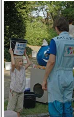
Eine-Welt- und Umwelttag 2006 in Hamm