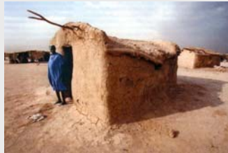
Dürre in Sudan, 2006