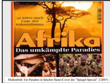
Medienbild: Ein Paradies in falscher Hand (Cover des "Spiegel-Special" 2/2007)