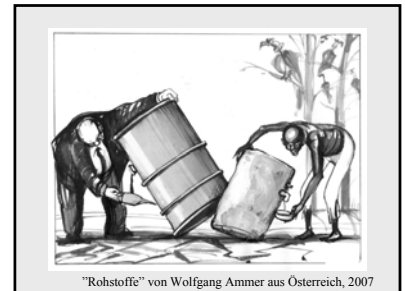
"Rohstoffe" von Wolfgang Ammer aus Österreich, 2007