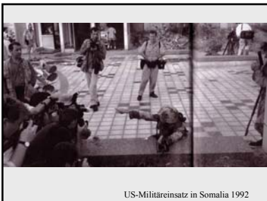
US-Militäreinsatz in Somalia 1992