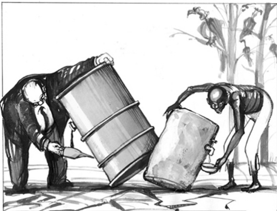
Resources in Africa von Wolfgang Ammer.jpg

Das Afrika-Seminar wird über InWent (Internationale Weiterbildung und Entwicklung gGmbH) aus Mitteln des BMZ und vom EED (Ev. Entwicklungsdienst) gefördert.