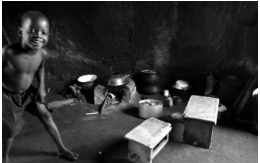
Blick in eine traditionelle Küche in Togo.