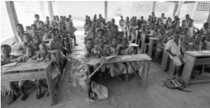
Sich hier zu konzentrieren und zu lernen ist eine Meisterleistung!

Klassenarbeit ansteht oder das Aufstehen morgens besonders schwer fällt – niemand könnte sich ernsthaft ein Leben ohne Schule vorstellen. Denn Schule bedeutet ja auch, spannende Dinge lernen, mit den Freunden auf dem Schulhof spielen und Erfolg haben.