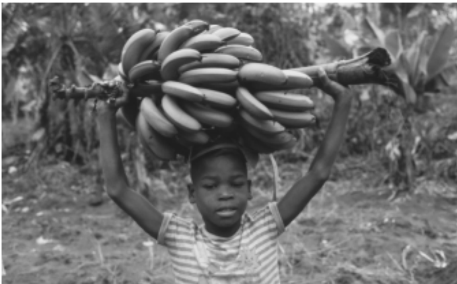
Chips kann man auch aus Bananen machen.

Afrika ist mehr als Fußball, mehr als Musik oder wilde Tiere, obwohl es alles das auf diesem riesigen Kontinent gibt. Und auf jeden Fall lässt es sich nicht auf Kriege, Katastrophen und Korruption reduzieren. Die Fußball-WM in Südafrika ist eine Gelegenheit, genauer hinzuschauen und das Angebot von Büchern, Filmen und Ausstellungen rund um Afrika und den Alltag der Menschen zu nutzen. ■