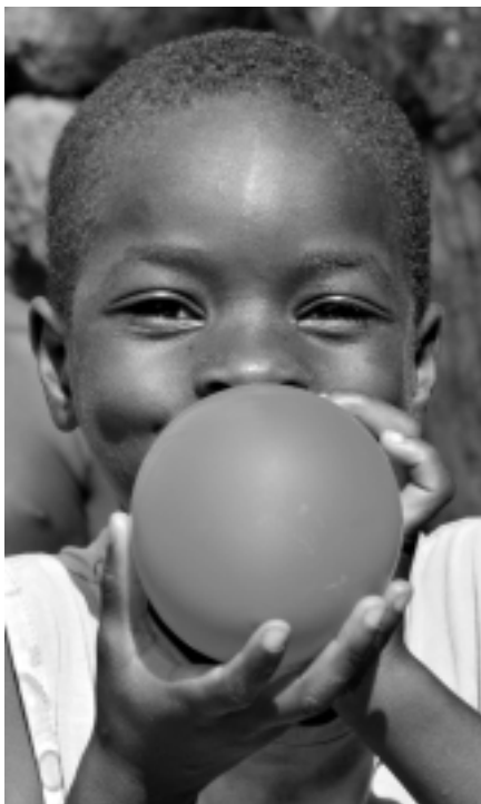
Wer wissen will, wie Kinder in Afrika leben, sollte mit offenen Augen hinschauen und sich überraschen lassen!

einmal eine riesige Jamsknolle in der Hand zu halten, sie zu schälen, in Stücke zu schneiden und zu frittieren. Wenn man dazu noch eine Soße aus Tomaten, Zwiebeln, Öl und Gewürzen macht, dann ist dieses typisch afrikanische Essen nährstoffreich und lecker – und kommt ganz ohne importierte Nahrungsmittel oder Konserven aus.