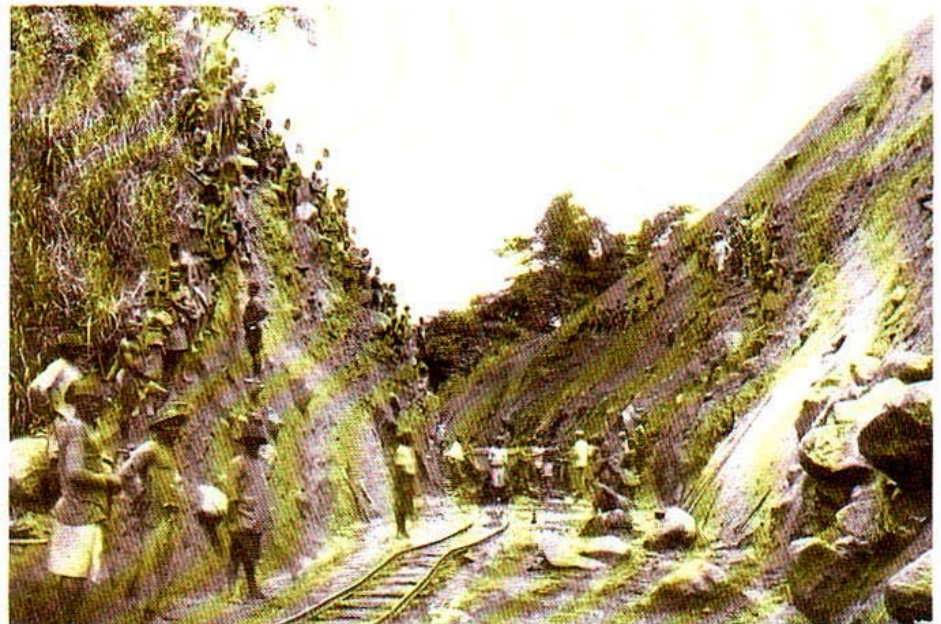
Wart der Mittellandbahn von Duala zum Njooakfluß. Trotzdem 5000 Arbeiter seit Jahren tätig sind, ist der Baufortschritt wegen der großen Geländeschwierigkeiten gering

I n diese relativ ausgewogene Verteilung der Lasten griffen die Kolonialmächte ein. Sie brauchten dringend Arbeitskräfte zur Ausbeutung der Kolonie. Männer wurden als Träger, Plantagenarbeiter und Soldaten rekrutiert. Durch Zwangsarbeit und die Einführung einer Kopfsteuer wurden sie außerdem zu Straßen- und Eisenbahnbau unter unmenschlichen Bedingungen gezwungen. Viele kamen dabei um.