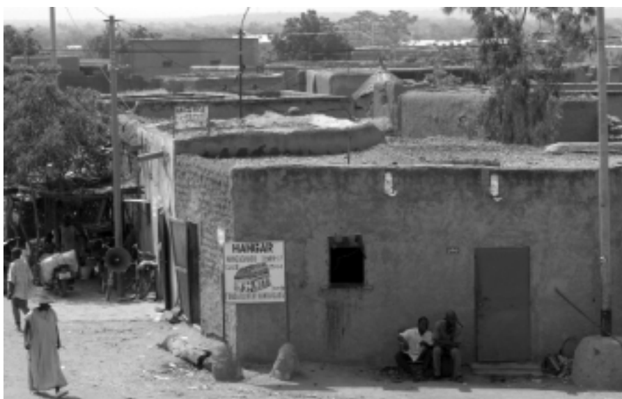
So unterschiedlich kann man wohnen – in nur einem afrikanischen Land, in Mali: Gehöft der Dogon (oben), im Stadtzentrum von Bamako (Mitte), in der Kreisstadt Bandiagara.