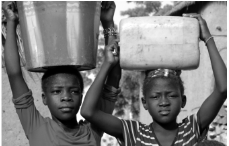
Wasserholen ist Schwerstarbeit – und Mädchensache!

Während in unseren Straßen China-restaurants und Mexikanische Grillstuben zur Normalität gehören und viele zum „Inder“ genauso selbstverständlich gehen wie zum „Italiener“, sind afrikanische Restaurants eine Seltenheit. In Brüssel oder Paris gibt es ganze Stadtviertel voll von Afro-Shops und Restaurants, die nicht nur Migranten zu ihren Kunden zählen. Doch in den meisten deutschen Städten muss man schon eine Weile suchen, bis man Köstlichkeiten aus Afrika kaufen und probieren kann. Es macht riesigen Spaß, mit Grundschulkindern tropischen Obstsalat zu schnetzeln und dazu Hirse zu kochen, weil nach anfänglicher Skepsis alle begeistert zugreifen. Noch interessanter wird es mit Jugendlichen, die bereits verinnerlicht haben, dass Afrika ja der „Hungerkontinent“ ist und es logischerweise dort nichts Rechtes zu essen gibt. Vor 100 Jahren galt Afrika als Inbegriff der tropischen Genüsse – man denke nur an die „Kolonialwaren“! Umso spannender ist es,