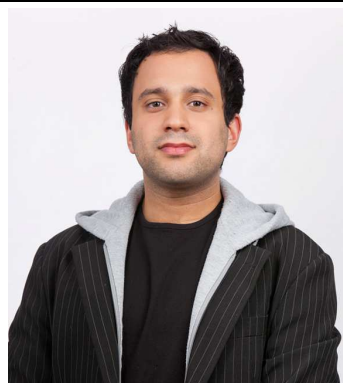
Niema Movassat, MdB, Die Linke