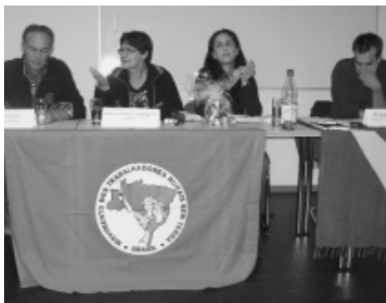
Bild links: Fachgespräch bei FUGe Hamm Bild rechts: Abendgespräch in der VHS Hamm